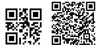
ショートメッセージ メール

☑ 利用当日7:30までに ショートメッセージ又はメールで『お名前とキャンセル理由』を送信して下さい。確認でき次第、返信します。